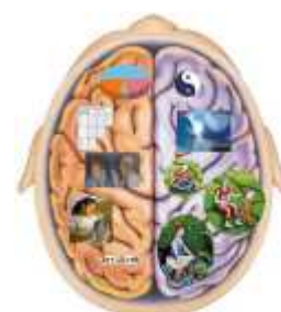
Értelem és intuíció