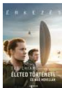
Emlékszem, milyen lesz