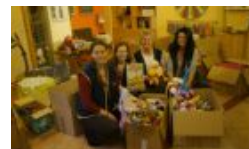
Varázsolj karácsonyt 2016-ban is!