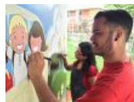
Azt mondták... az emberségről