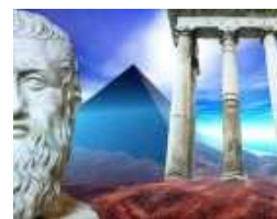
(Nem is olyan fiktív) interjú Platónnal a nevelésről