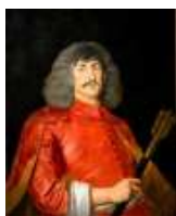
Jószerecse, semmi más!