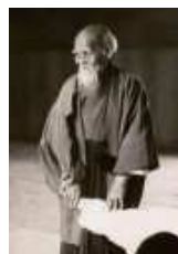
Ahol Harc dúl... Harmónia terem