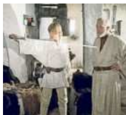
Az ébredő belső erő