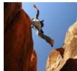
Kis lépések az embernek...