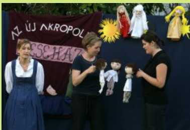
A belépés díjmentes

A mesét az előadás után a gyerekekkel közösen adjuk elő saját készítésű jelmezekben.