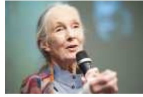
A türelem ereje – Jane Goodall