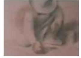
Az ember, aki fákat ültetett

„Hogy lehet az, hogy ha az emberi alkotásokat tönkreteszik, azt vandalizmusnak hívjuk, de ha a természet művét, Isten teremtményeit semmisítik meg, azt haladásnak mondjuk...” Jane Goodall