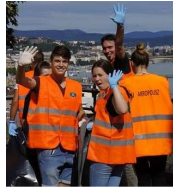
A természet és bölcsesség szerelmesei