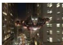
Herkules, a Vasember