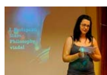
Azt hiszem, nem véletlen