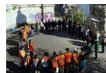
XXII. Gellért-hegyi akció